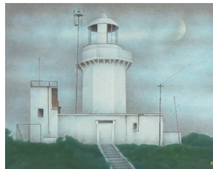
6. 《佐田岬行》1993年 福知山市佐藤太清記念美術館 蔵

※「夏の思い出」などで知られる20世紀を代表する作曲家・中田喜直は、佐藤太清と交流し、この《旅途》についても音楽的なコメントを残しています。本年、生誕100年を迎える中田喜直とのコラボとして、板橋区立美術館、八幡浜市美術館ではミュージアムコンサートが開催されます。