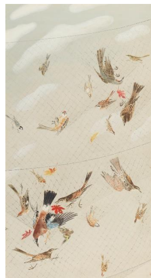
2. 《かすみ網》1943年 板橋区立美術館 蔵

柳の枝に冷たくも重みを持たせた雪の世界。潮の匂いを想起させる海辺の情景。最初期における水の表情は、未ださりげない。雪や海の存在は、群れて騒ぐ鳥や海辺で暮らす人々の生活といった主題を物語るための背景ともいえます。その後《竹窗細雨》(1951年)においては、降る雨のしずく、雨がもたらす部屋の湿度、室内の水槽など、水を描き分ける手法を追求。絵画の世界に漂う空気を感知させる表現が顕在化されるようになりました。また30歳にして、新文展へ初入選した《かすみ網》(1943年)には、死にゆく鳥と平穏な空という対極の世界が描かれます。太清の生涯におけるテーマといえる水の様相と対極のイメージは、既にこの時代から内在されていたといえます。