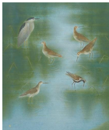
5. 《旅途》1988年 福知山市佐藤太清記念美術館 蔵