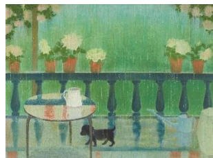
3. 《雨の日》1952年 福知山市佐藤太清記念美術館 蔵

光景と空気に対する表現の比重を大胆に変化させつつ、実験的な画面構築を行ったのがこの時代です。